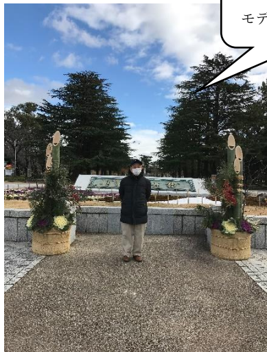
元旦の鶴舞公園 モデルは無視ください