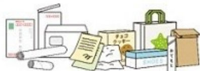
雑がみ (紙の原料になる紙製容器包装も含む) (注)